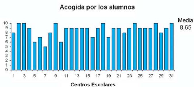
Figura 4. Evaluación de la acogida del Programa Educativo por los alumnos

La puntuación media sobre la acogida del Programa Educativo por los alumnos fue 8,65 (rango de 5 y 10 puntos), la desviación estándar de 1,226 y el intervalo de confianza para la media al 95% de 8,20 y 9,09 (p<0,05) (figura 4). En la figura 5, se recogieron los datos sobre los porcentajes de negativa familiar a la donación de órganos a nivel nacional, publicados por la Organización Nacional de Trasplante (ONT)4 y los porcentajes de negativa familiar que se produjeron en el hospital de referencia5 que atiende las necesidades sanitarias de una parte importante de la población y por lo tanto, de los alumnos y familiares de los centros escolares que han participado en el Programa Educativo.