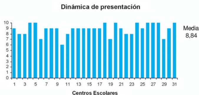
Figura 3. Evaluación de la dinámica de presentación del Programa Educativo.

La puntuación media sobre la dinámica utilizada fue 8,84 (rango de 6 y 10 puntos), la desviación estándar de 1,068 y el intervalo de confianza para la media al 95% de 8,45 y 9,23 (p<0,05) (figura 3).